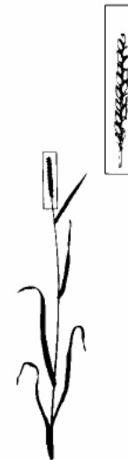
Ende des Ährenschiebens (59)