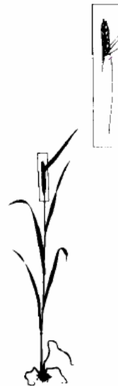
Beginn des Ährenschiebens (51)