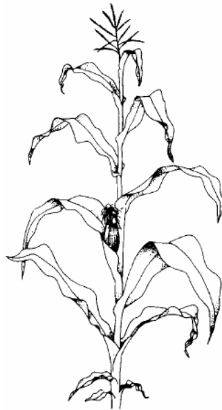
Ende der Blüte (69)