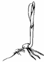
1. Laubblatt entfaltet (11)