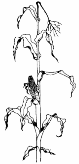
Vollreife: ca. 65% TS im Korn (89)