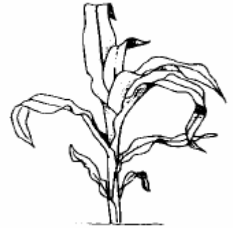
7. Laubblatt entfaltet 2. Stängelknoten wahrnehmbar (17/32)