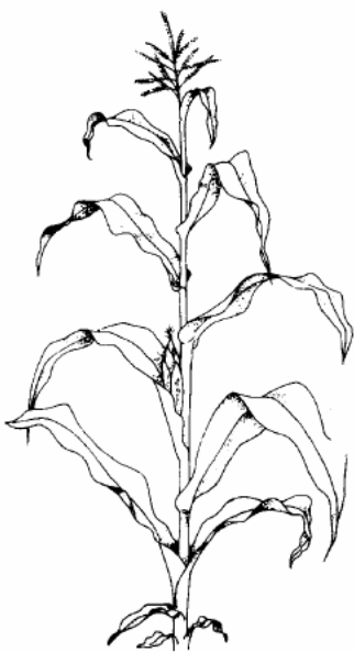
Pollenschüttung beginnt Spitzen der Narbenfäden sichtbar (63)