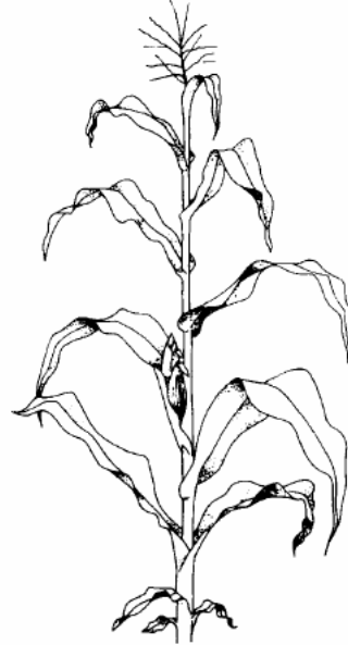
Art- bzw. sortenspezifische Korngröße erreicht (69)